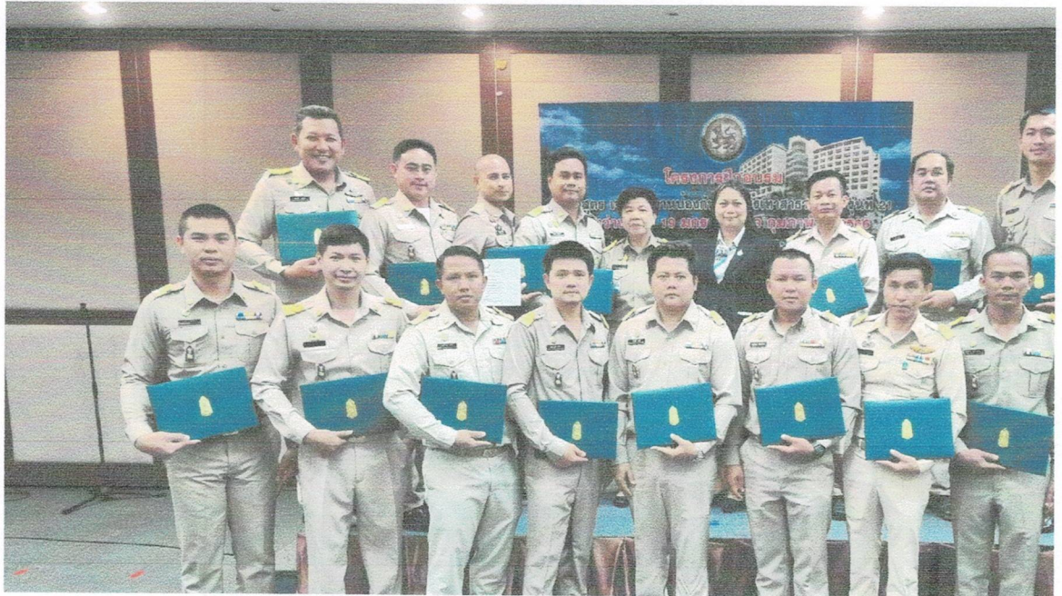
ส่งบุคลากรเข้ารับการอบรม

Happy Brain (หาความรู้) ส่งเสริมให้บุคลากรเรียนรู้ หรือเข้ารับการอบรมในส่วนงานที่เกี่ยวข้อง และสามารถนำมาใช้พัฒนางานได้